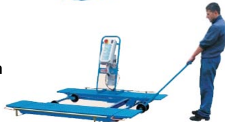
Hjulsats För att lätt kunna flytta lyften Art.nr. RAV-1450A1