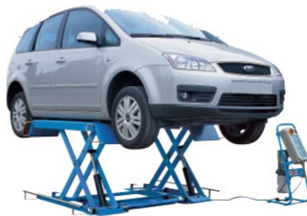
Saxlyft 2,5 Ton Idealisk lyft för service,däck och plåtverkstäder Art.nr. RAV-1450N