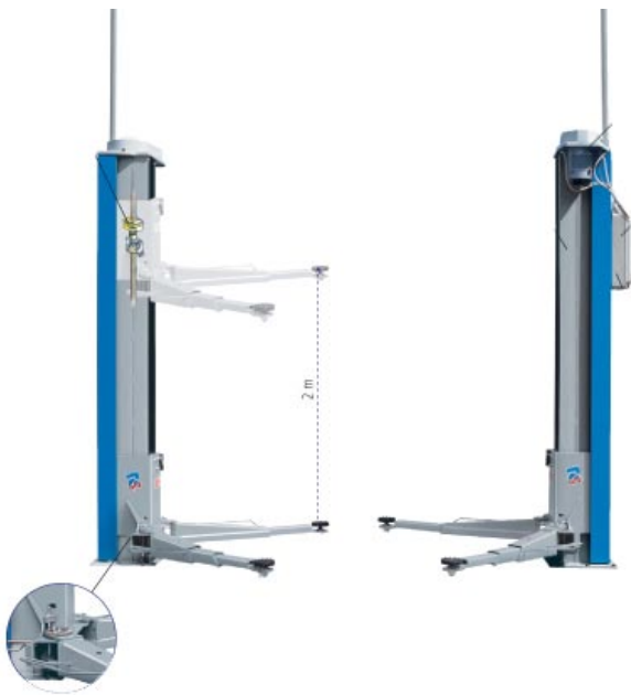
Tvåpelaryft 3,2 Ton Fundamentsfri 2-pelaryft Art.nr. RAV-KPX337W