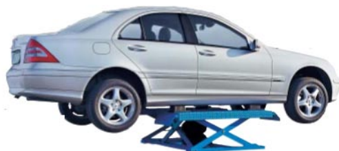
Däckslyft 2,5 Ton För snabba lyft vid däckbyten Luftdriven, min höjd 90 mm Art.nr. RAV-1380